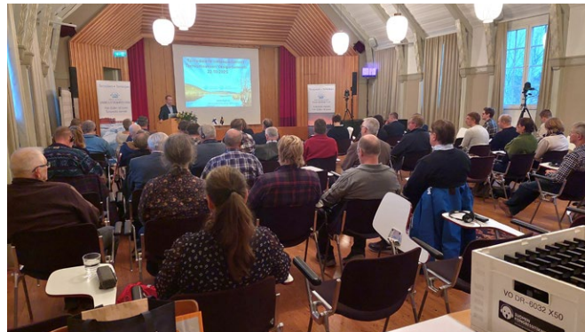
Gränsöverskridande Vattenparlament seminariet inresserade på båda sidorna av gränsen, drygt hundra deltagare varav tjugotal på distans.

Naturresursinstitutet i Finland (LUKE) startade en forskning på vandringsfiskar i Torneälven där sikarnas lekområdet samt sikbeståndets status kartläggs. Finsk-svenska gränsälvskommisionen delfinansierar forskningen med 28 500 € under åren 2025, 2026 och 2027.