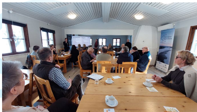
Workshopar angående skyddsplan för håvfiske samlade många deltagare.

Sekretariatet har deltagit i tre workshopar angående skyddsplan för håvfiske vilka har arrangerats under året. Workshoparna är relaterade till den gemensamma finska och svenska ansökan om att få det traditionella håvfisket i Kukkolaforssen och Matkakoski till UNESCO:s lista över immateriella kulturarv. Fjärde och sista workshopen anordnas i januari 2026.