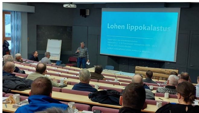
Diskussionen om fiskestadgan var livlig på mötet för intressegrupper som arrangerades tillsammans med Jord- och skogsbruksministeriet.

Kommissionens sekretariat och en del av ledamöterna deltog i intressentmöte i Ylläs som anordnades av jord- och skogsbruksministeriets fiskemyndigheter. Mötet handlade om 2025 års fiskeregler i Torneälven och tillställningen anordnades i samarbete med kommissionens sekretariat och ministeriet. Ungefär 50 deltagare från områdets andelslag, fiskeområden och kommunerna fanns på plats.