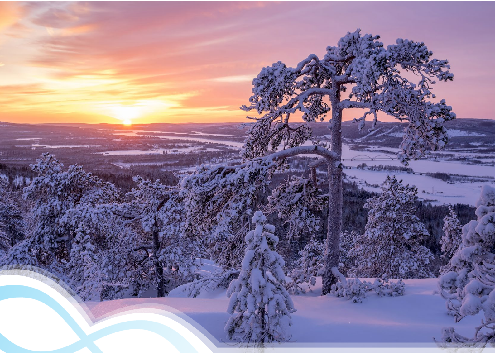
Aavasaksa vintersnölandskap