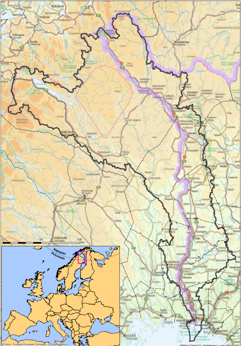
Tornioväylän valuma-alue oon kartassa rajattu mustala.

Puhthaat veet oon kaiken elämän perusta.