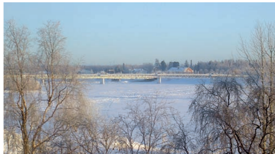
Tornioväylä Tornion Suensaaren kohala.

Pohjoskalotin neuosto Tel +358 16 211 4324