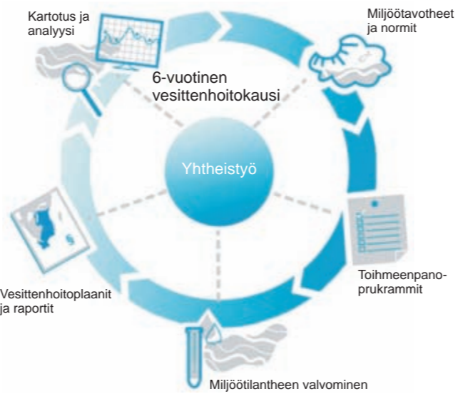
Vesittenhoitoplaani tehään joka kuues vuosi.

Euruupan Yniuunin tulvatirektiivin mukhaan jäsenmaitten pittää tehdä preliminääri riskianalyysi ja kans kartottaa tulva-alueet ja riskit niillä alueille. Ruottissa preliminäärin riskianalyysin tekkee MSB (Yhteiskuntasuojan ja valhmien viranomhainen) ja Norrbottenin lääninhallitus tekkee jatkotyön. Suomessa net plaanit jotka koskevat Tornioväylää tekkee Lapin ELY-keskus