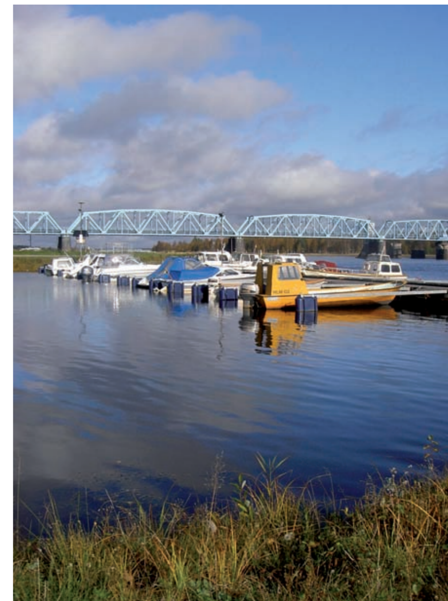
Suomen ja Ruottin yhtheinen rautatiesilta ylittää Tornioväylän. Etualala Haaparannan venehamina.